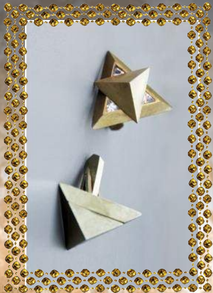
Елена Горбунова. Запонки "Solid". 1 место в номинации "Ювелирные новации" на конкурсе авторского ювелирного и камнерезного искусства "Ювелирный Олимп-2012".