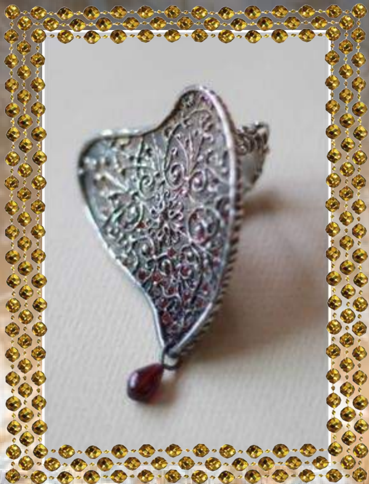
Мария Ноур. Из коллекции "Игрушки красной королевы". 2 место в номинации "Удачный дебют" на конкурсе авторского ювелирного и камнерезного искусства "Ювелирный Олимп-2012".